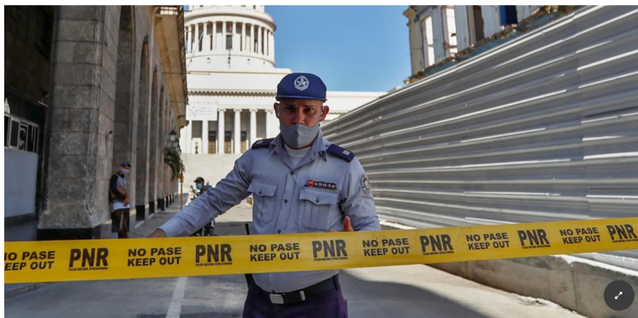
Un policía impide el paso en las zonas aledañas al Capitolio, como medida ante las protestas antigubernamentales, en La Habana.

El gobierno comunista de Cuba, por su parte, acusan a Estados Unidos de estar detrás de las protestas.