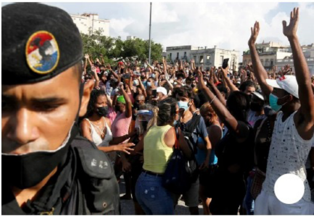
Una imagen de la protesta en La Habana, este domingo.