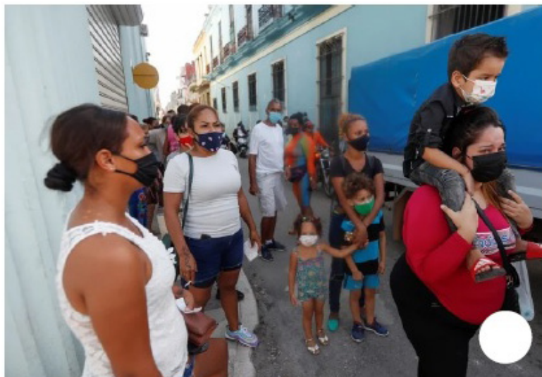
Familiares de detenidos se concentran cerca de una comisaria en La Habana, para pedir información.

De parte de la organización Damas de Blanco, se reportó también el arresto de su líder Berta Soler y de su esposo, se dio también, el arresto de una periodista