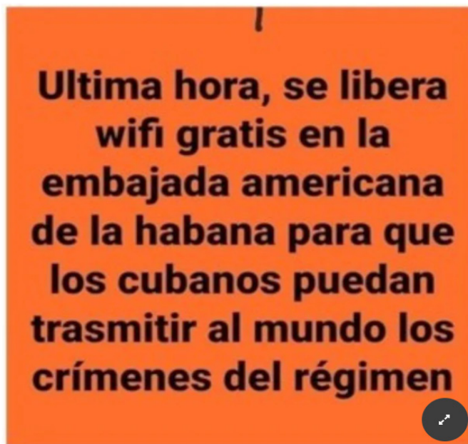
Anuncio en Facebook.

La "APK", llamada, "Psiphon", les permite conectarse. La misma debe ser descargada mientras este conectado a internet, luego se configura en el celular, para así poder tener internet. Sin embargo, la mayoría de los cubanos no cuentan con celulares de alta gama, por lo cual se hace difícil su descarga para todos. Gracias a esta "APK", quienes logran instalarla, logran subir videos o enviárselos a sus familiares en el exterior y estos a su vez lo suben a sus redes sociales.