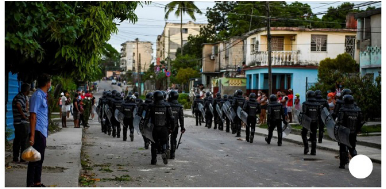
Gran despliegue policial en el municipio de Arroyo Naranjo, cerca de La Habana, en respuesta a las protestas que sacuden a Cuba.